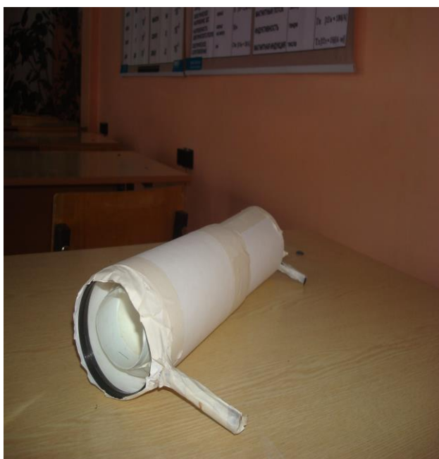
5. Действующая модель зрительной трубы. (телескоп)