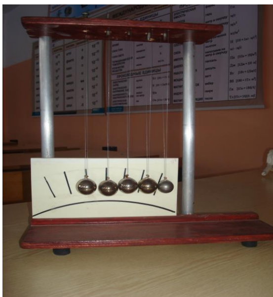
1. Прибор для демонстрации законов импульса и энергии

(приборы, сконструированные на элективном курсе)