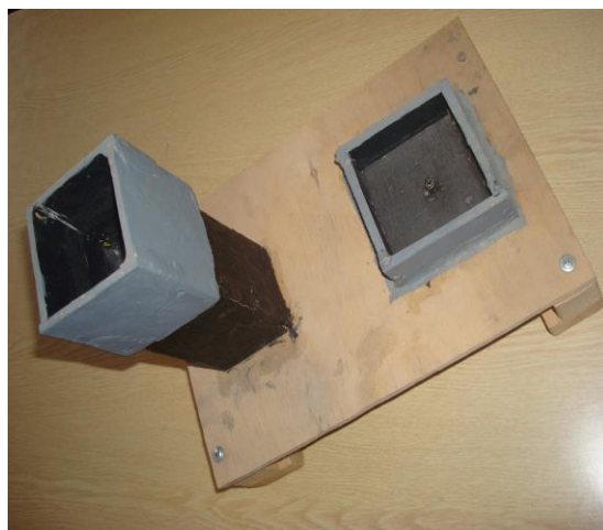
4. Действующая модель фонтана.